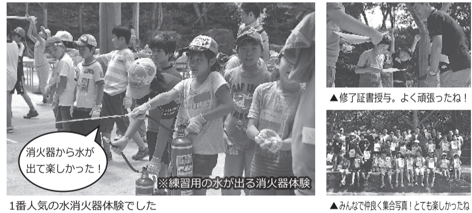
1番人気の水消火器体験でした

7月27日、七ヶ宿・会幸村にて行われましたデイキャンプで見つけた笑顔をご紹介します。担当…白石刈田未来創造 (S・K・F・C) 委員会; 遠藤直秀委員長