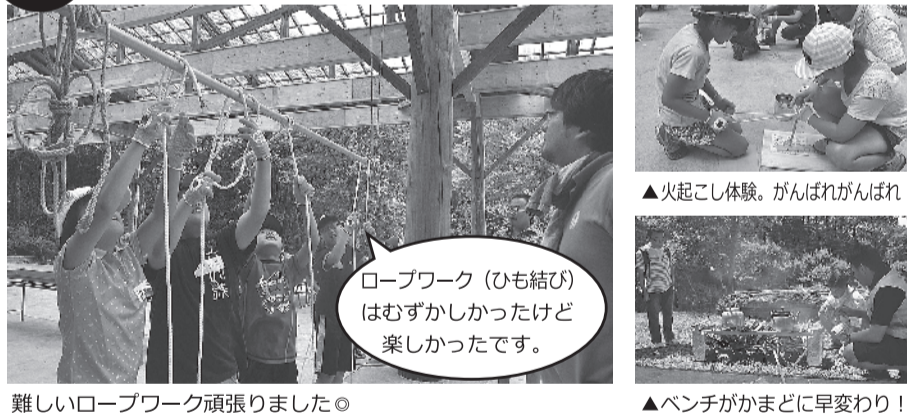
難しいロープワーク頑張りました

7月27日、七ヶ宿・会幸村にて行われましたデイキャンプで見つけた笑顔をご紹介します。担当…白石刈田未来創造 (S・K・F・C) 委員会; 遠藤直秀委員長