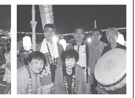
迫力ある生演奏で会場を盛り上げていただいた鷹巣神楽保存会のみなさん