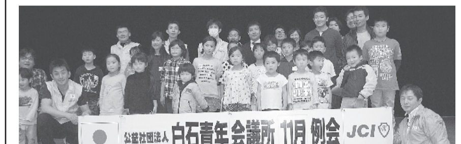
時代を超えて「つながった」ことで、ゲームでは味わえない、むかしのあそび・体を使ったあそびの楽しさを伝えることができました。

「ちょっとむかしのあそび」を体験しよう 私たちメンバーが子どもの頃にやっていた「Sケン」や「長馬のり」などを今の子どもたちに体験してもらいました。