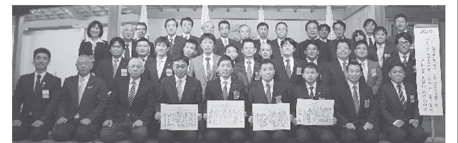
当日、併せて登別室蘭青年会議所と海老名青年会議所の姉妹JC締結式も行われました。3都市の青年会議所がお互い手を取り合って協力していくことを誓いました。

姉妹JC締結調印式 10月16日、碧水園にて登別室蘭青年会議所との姉妹JC締結式が行われました。今後さらに交流を深め、お互い地域の発展のために協力していくことを誓いました。